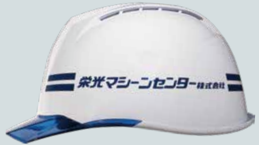
社名印刷参考例：AA11EVO-CWヘルメット