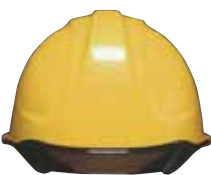
COLOR 帽体 黄 バイザー スモーク