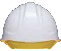
COLOR 帽体 白 バイザー 蛍光オレンジ