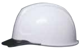
COLOR 帽体 白 バイザー スモーク