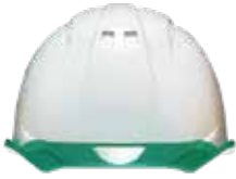
COLOR 帽体 白 バイザー グリーン