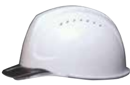
COLOR 帽体 白 バイザー クリア