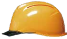
COLOR 帽体 黄 バイザー スモーク