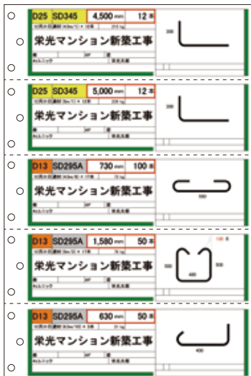
カット荷札 A4用紙 10分割・5分割対応しています。