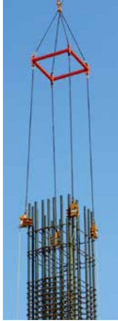
・柱吊用天秤とクランプを使用して 柱筋を安全確実に移動できます。