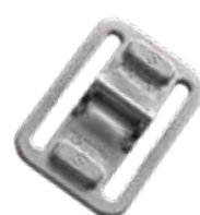
SPHベルトキャッチャー-S