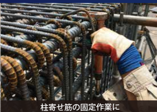
柱寄せ筋の固定作業に