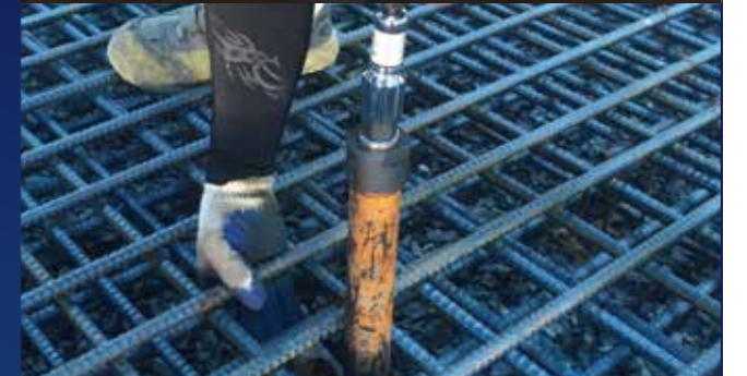
スペーサー手直し時のスラブ持ち上げ作業