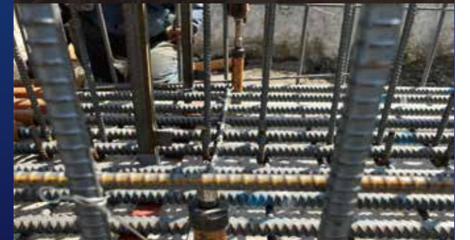
ネジ筋のカプラセット時の高さ調整に

先端部をテーパ形状にしてあることで、 狭い隙間(22mm)から鉄筋を広げることが可能!!