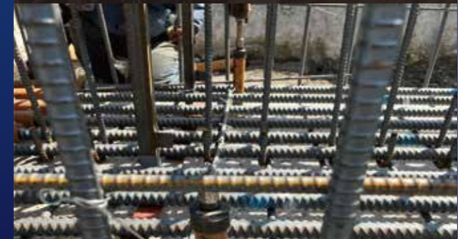
ネジ筋のカプラセット時の高さ調整に