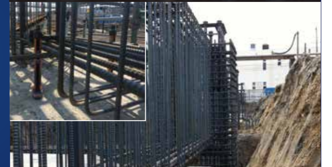
スタラップ配筋時の下筋の持ち上げに