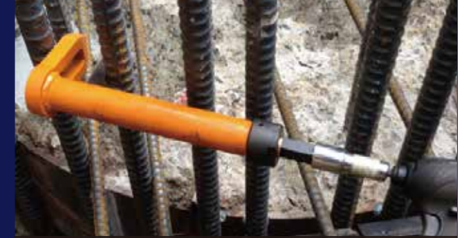
杭頭筋へベース筋を通す作業に