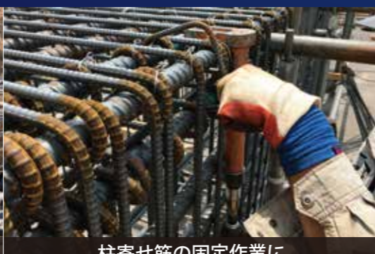
柱寄せ筋の固定作業に