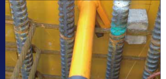
ドーナツが潰れてしまった場合の手直しに