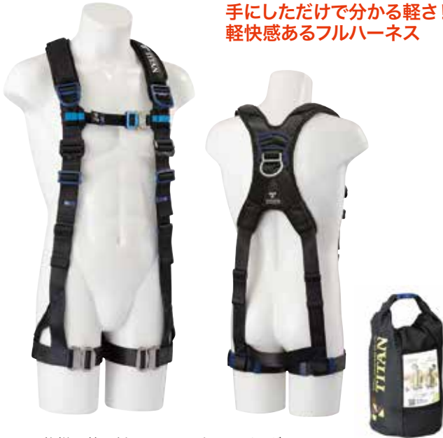
■仕様 第1種 フルハーネス パンギア