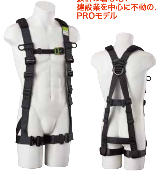
■仕様 第1種 フルハーネス 江戸鳶