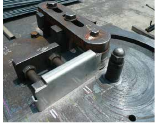
※支点軸径はD10加工時の条件になります