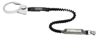
■仕様 タイプ1 伸縮ストラップ式ランヤード