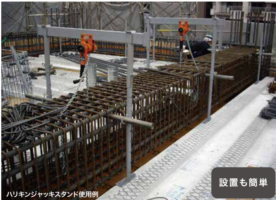
ハリキンジャッキスタンド使用例