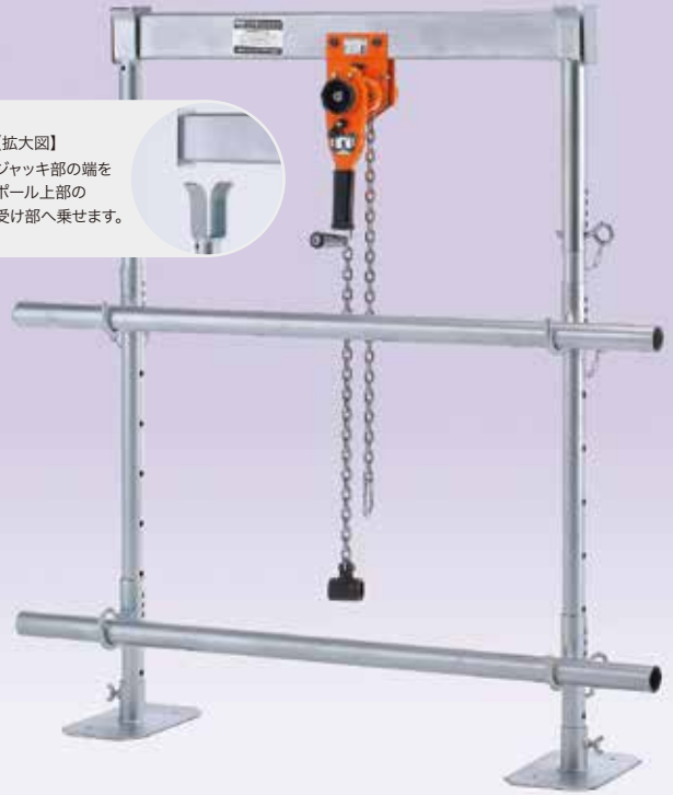
HS-111J ※単管は別売りです。