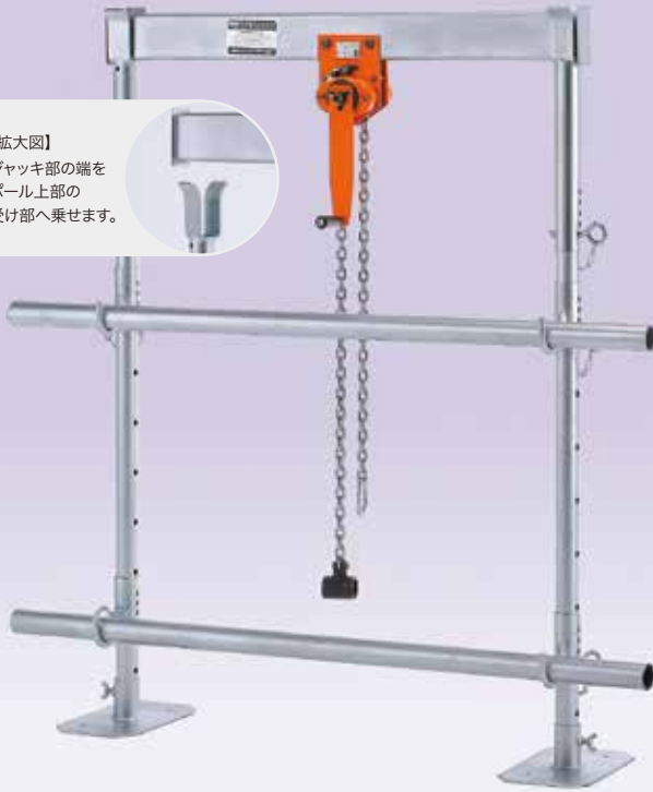
HS-110J ※単管は別売りです。